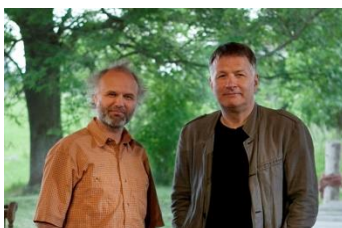
Gastspiel des